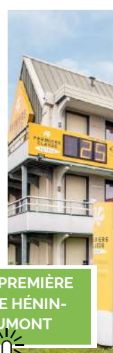
HÔTEL PREMIÈRE CLASSE HÉNIN- BEAUMONT