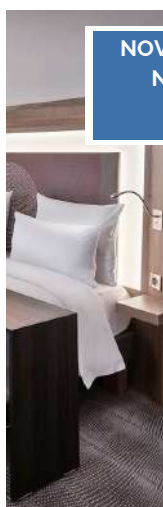
NOVOTEL LENS- NOYELLES